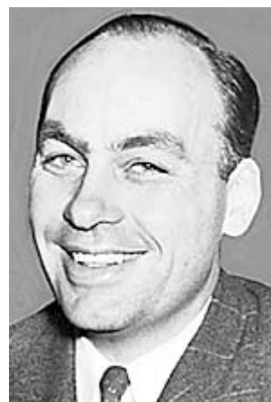
George Horrace Gallup

Det var den nye markedsanalyse-teknik, anvendelse af den repræsentative stikprøve, der havde stået sin prøve.